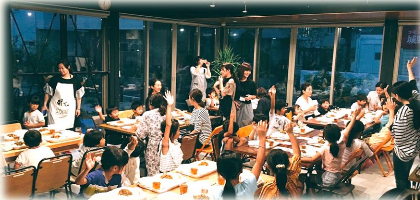
↑もうすぐ皆で「いただきます。ご飯はそろったかな？」

最後に、現在たべTETTEでは運営メンバーを募集しています。運営に携わってくださる方、より詳しい話を聞きたい方、興味のある方はぜひお気軽にタウンマネージャーさんにご連絡ください。