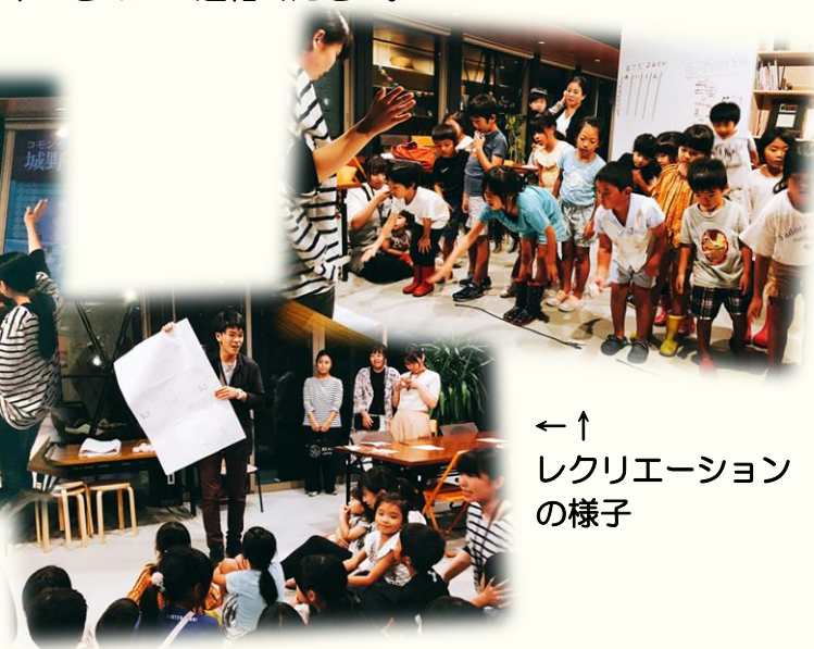
←レクリエーションの様子