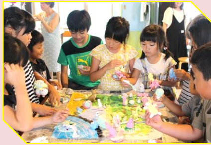
オリジナル動物園！

生き物図鑑作りは、北九州高校の魚部の皆さんに来ていただき、生物採集・図鑑作り・釣りゲームを行いました。子供たちは元気にTETTE前の公園でバッタやとかげをとり、TETTEに戻ってからは魚部の方に生物の特徴を聞きながら、真剣に図鑑作りを行っていたのが印象的です。見本がTETTEにありますのでもしよければご覧ください。