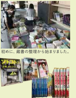
初めに、蔵書の整理から始まりました。

空間づくりとしては、小さな子供たちが安心して遊べるマット式のキッズスペースや照明器具を増設するなどゆっくりくつろいで読書ができるよう計画しています。また、小学生のお子さんが読む児童書や、大人の皆さんが楽しめる雑誌など、新たに書籍を購入し、蔵書の充実を図っています。本のリクエストBOXも設置しますので、おすすめの本など、ぜひ教えてください！