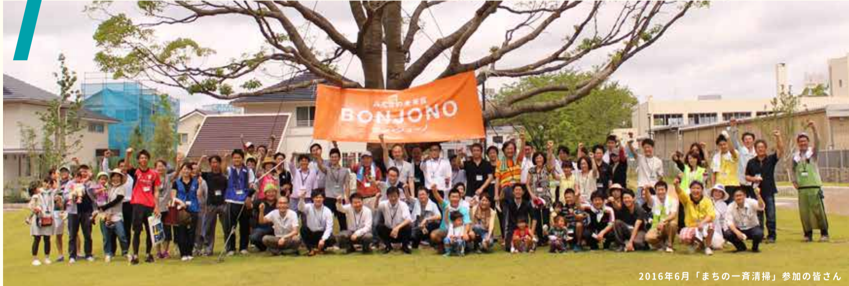
2016年6月「まちの一番清掃」参加の皆さん

JR城野駅北に誕生した、みんなの未来区 BONJONO (ボン・ジョーノ)。 このまちに関わる「みんな」が暮らしを楽しみ、「未来」を育む、 新しいまちづくりは、すでに始まっています！