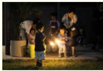
花火に大興奮の子どもたち