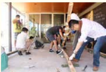
お父さんたちで竹割り