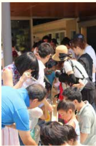
一列に並んでそうめん流しスタート

ボン・ジョーノ夏満喫企画！『竹の組立から作ろう！そうめん流し』を7月31日(日)に開催しました。竹を割って切って磨いて、お父さん達の大活躍によりそうめん流しの土台が完成！たくさん汗をかいたあとのそうめん流しは、冷たくておいしかったです。涼を感じる素敵なイベントになりました！