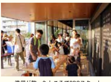
準備が整ったところでBBQスタート