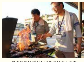
暑さに負けずがんばるお父さんたち