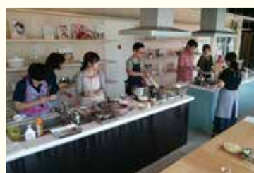
ふたつのキッチンを使ってお料理