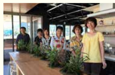
みんなで集合写真。楽しく学べました