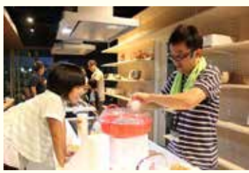
綿菓子のできあがり待ち遠しい