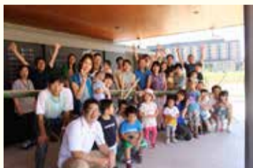
みんなで集合写真を撮るバシャリ