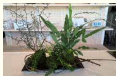
暑い夏にピッタリの涼しげな仕上がりに