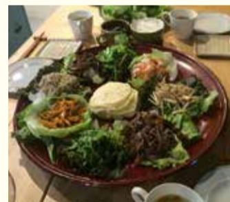
韓国宮廷料理「九節板」完成